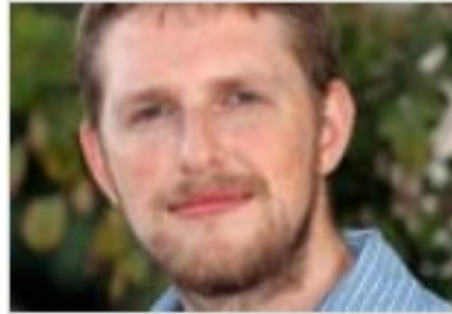
מייסד וורדפרס מאט מאלנווג